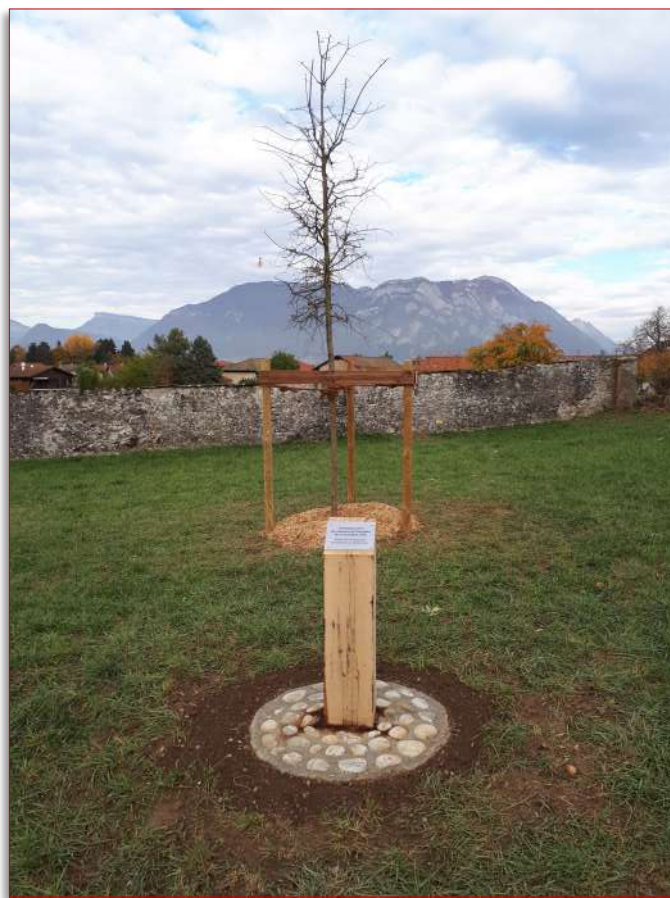
Plantation d'un chêne fourni par la communauté de communes du Grésivaudan pour le centenaire de l'armistice du 11 novembre