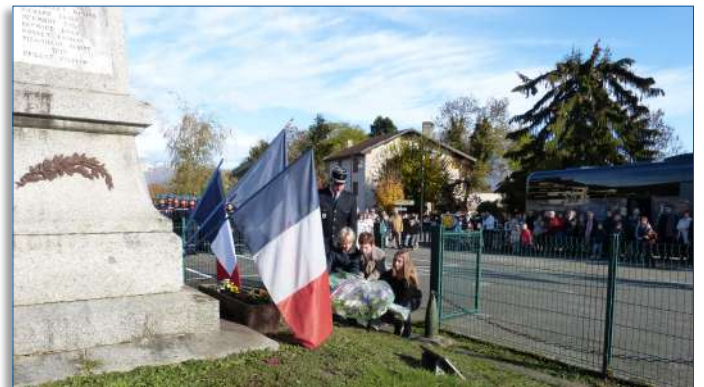
Dépôt de gerbe au monument aux morts