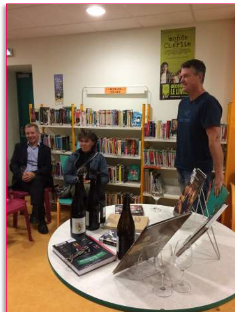
Découverte du domaine et des étapes de la vinification biologique