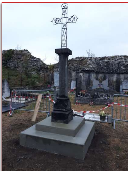
Remise en état du socle de la croix du cimetière de Bellecombe