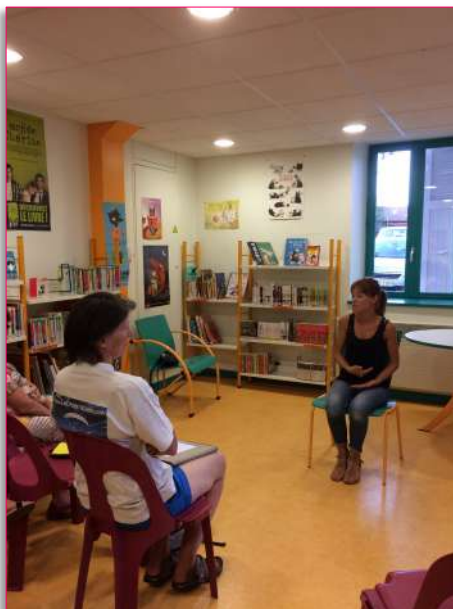
Explications et conseils en sophrologie