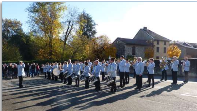
L'Harmonie des Enfants de Bayard