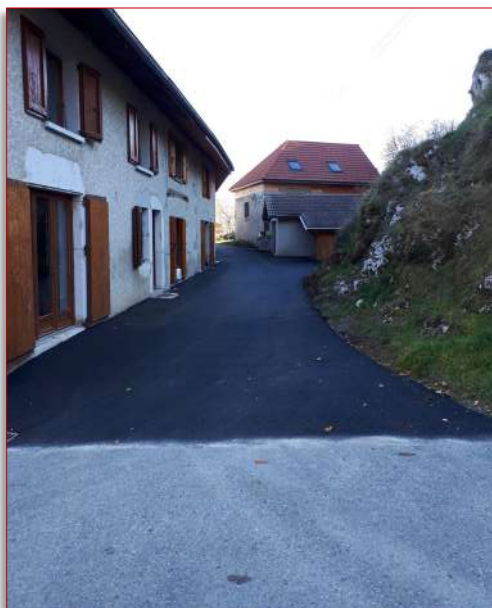
Chemin de Barioz, Bellecombe