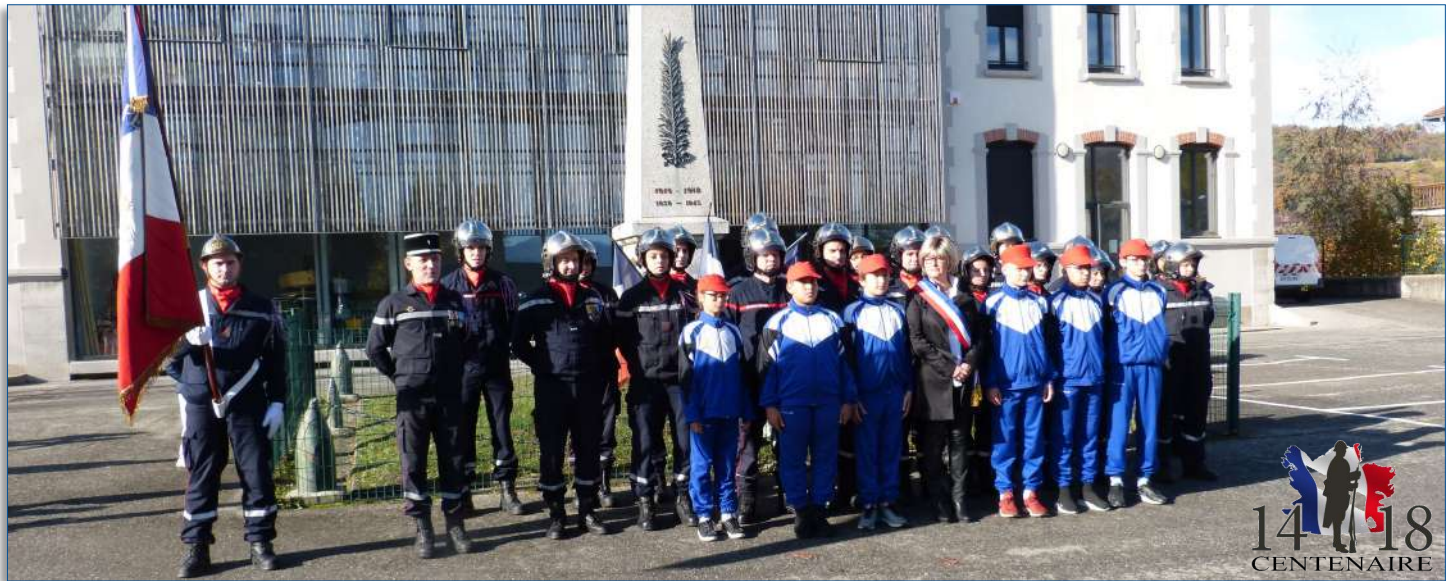
Commémoration de l'armistice en présence des sapeurs-pompiers et de la section jeunes sapeurs pompiers