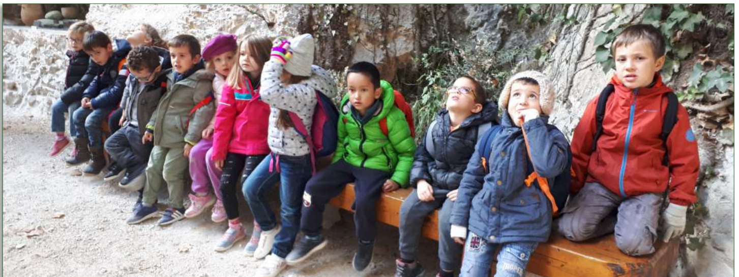
Visite de la grotte de Choranche, le mercredi 31 octobre

C'est le nombre moyen d'enfants par jour d'ouverture de l'ALSH Soit 20 % de plus qu'en 2017