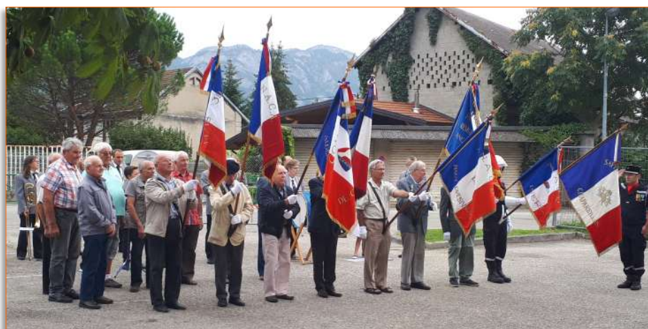
Commémoration de la libération de Chapareillan, le 25 août 2018