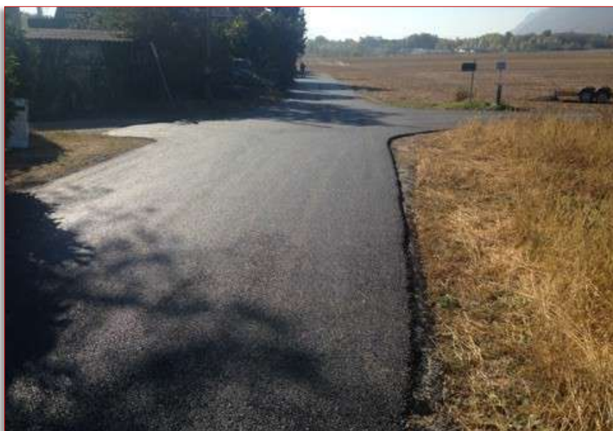
Chemin des hermitants