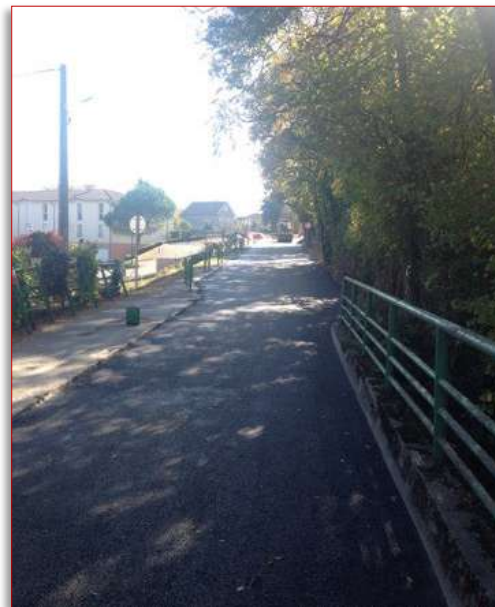
Rue du Souvenir Français