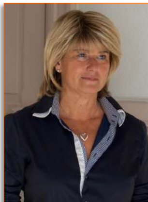
MARTINE VENTURINI-COCHET Maire de Chapareillan