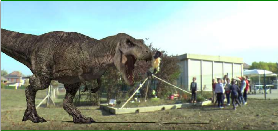
Semaine vidéo avec Eric Fitoussi