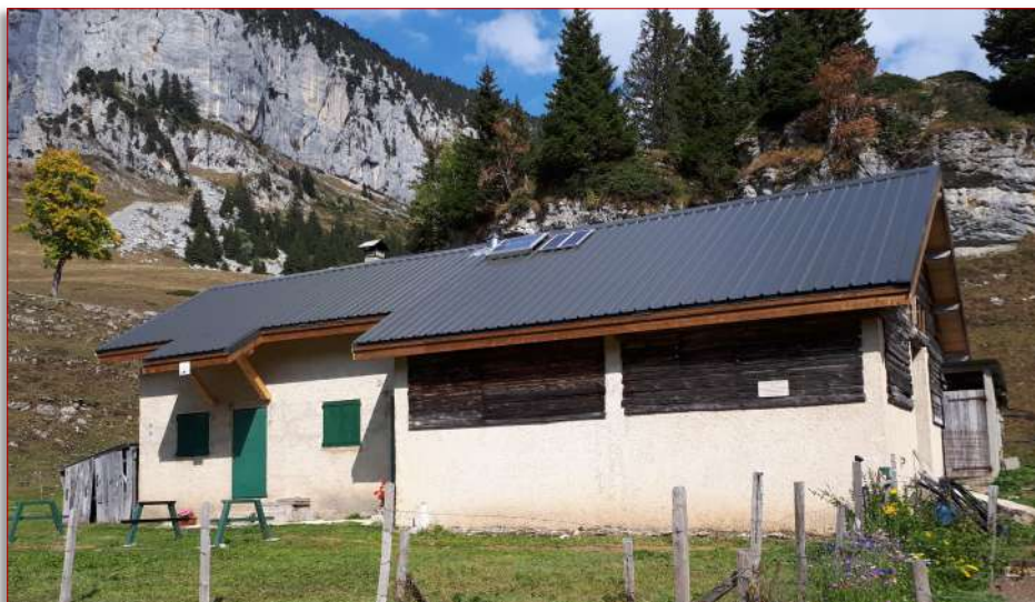
Rénovation et isolation de la toiture et changement des portes et des fenêtres