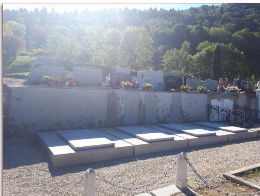
Pose des ossuaires au cimetière