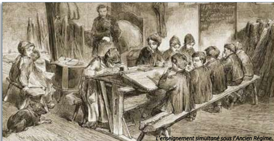
L'enseignement simultané sous l'Ancien Régime.