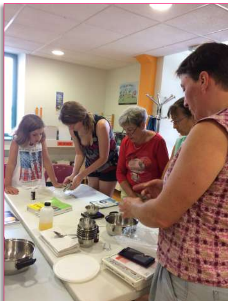
Découverte des huiles essentielles et confection de baumes à lèvres