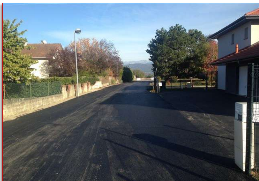
Chemin des noyers