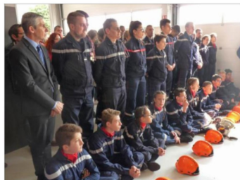
Les jeunes sapeurs-pompiers ont été félicités.

Le préfet de l'Isère, Lionel Befe, a vanté les mérites du Centre d'intervention et de secours (CIS) de Chapareillan et de ses sapeurs-pompiers.