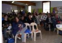
Une cinquantaine de personnes ont assisté à cette conférence sur le numérique et la recherche d'emploi