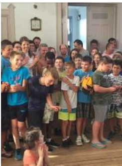
Les 54 élèves impatients de recevoir leur cadeau

Dans un peu plus d'une semaine, la fin de l'école sera effective et, pour les élèves de CM2, il sera tant de dire au revoir à quelque huit années passées tout d'abord à la maternelle puis à l'élémentaire pour rejoindre en septembre prochain le collège. 54 élèves entreront dès la rentrée de septembre au collège.