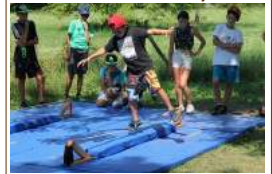
Tout au long de la semaine, les enfants ont découvert la slackline

Tout au long de cet été, l'Accueil de loisirs sans hébergement (ALSH) ouvre ses portes, proposant de nombreuses activités aux enfants.