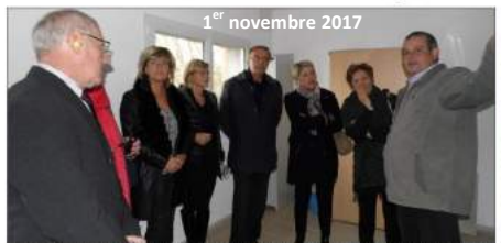
1 er novembre 2017