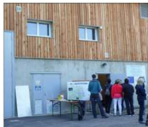
La microcentrale a bénéficié de subventions de l'Union européenne et de l'Agence de l'eau.