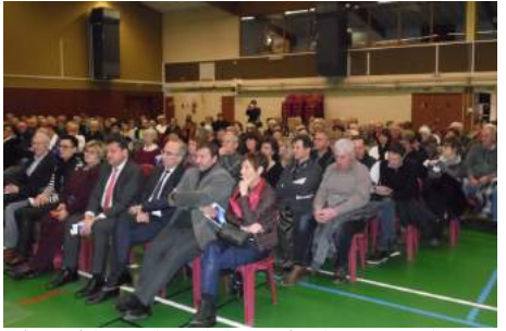
C'est entourée de son conseil municipal et devant une très nombreuse assistance que la maire a présenté ses vœux à la population