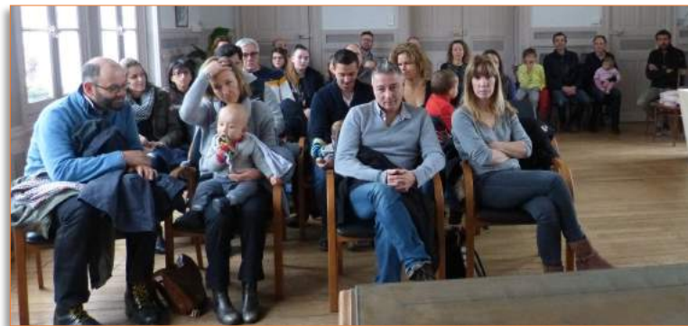
Accueil des nouveaux habitants, le 18 décembre 2017