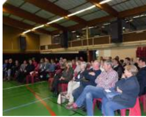
De nombreuses personnes ont assisté à la conférence portant sur l'étymologie. ... l'importance d'utiliser le bon mot pour respecter l'autre