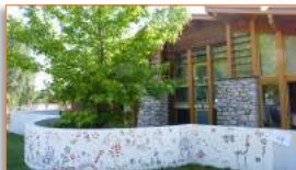
Nouvelle fresque pour l'école maternelle