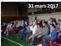
Ce sont une centaine de personnes qui ont assisté à cette réunion publique

habitants, c'est en tout cas la volonté qui est affichée par les élus.