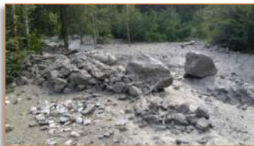
Orages du 15 juin 2017

mercredi soir, la présence de particules d'argiles est en effet importante et a dépassé le seuil admis dans le réseau d'eau potable. Selon la mairie, la consommation d'eau n'est pas dangereuse mais est donc déconseillée par mesure de précaution. De l'eau minérale est mise à disposition des habitants en mairie. Selon Mme Martine Venturini-Cochet, la situation devrait rapidement revenir à la normale.