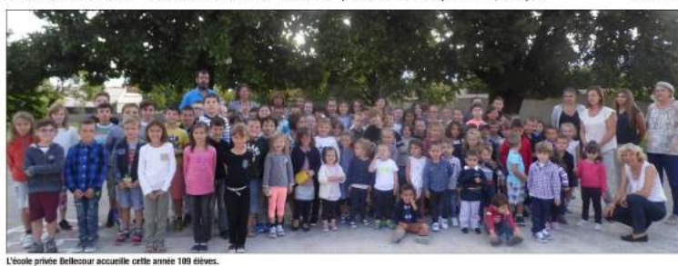
L'école privée Bellecour accueille cette année 189 élèves.