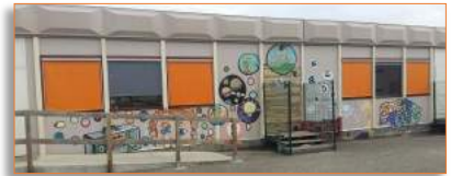
Nouveaux stores et nouvelle cuisine aux bungalows

Renseignements et inscriptions : accueil de loisirs au 04 76 71 91 34 ou enfance jeunesse@chapareillan.fr