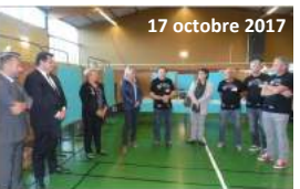
Le 17 octobre 2017, lors de l'inauguration de la saison estivale, des dégustations ont été organisées à Bèze de Grappe.

Après deux jours de fête autour de la gastronomie et de la culture, les poteries de Salon Terroir et Création ne sont pas terminées dimanche soir. Tout d'abord, le week-end, le public est venu en nombre écouter les artistes d'une belle variété musicale regroupés dans les cordons de l'été et de créations artistiques.