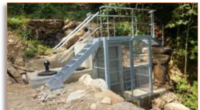
Finition de la passerelle à la source des Eparres et pose de panneaux explicatifs