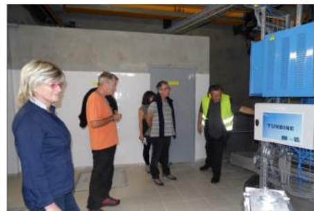
La visite de la microcentrale a beaucoup intéressé les Chapareillanais.