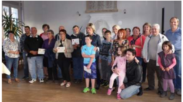
Onze familles ont participé à cette première édition du concours des illuminations.