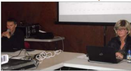
Martine Venturini-Cochet et Guy Roulet ont expliqué les conséquences de la baisse des dotations de l'Etat aux communes sur le budget de Chapareillon.