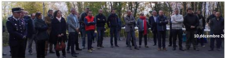
10 décembre 2017