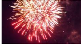
C'est par une belle retraite aux flambeaux que la soirée a commencé, avant que le feu d'artifice n'illumine le ciel de Chapareillan

C'est un formidable spectacle qui s'est déroulé jeudi soir aux abords de la salle polyvalente. En cette veille de fête nationale, et comme ils le font depuis trois ans maintenant, les sapeurs-pompiers du CIS Le Granier Chapareillan