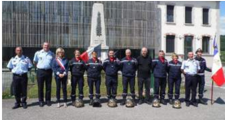
Les sapeurs-pompiers honorés aux côtés des autorités